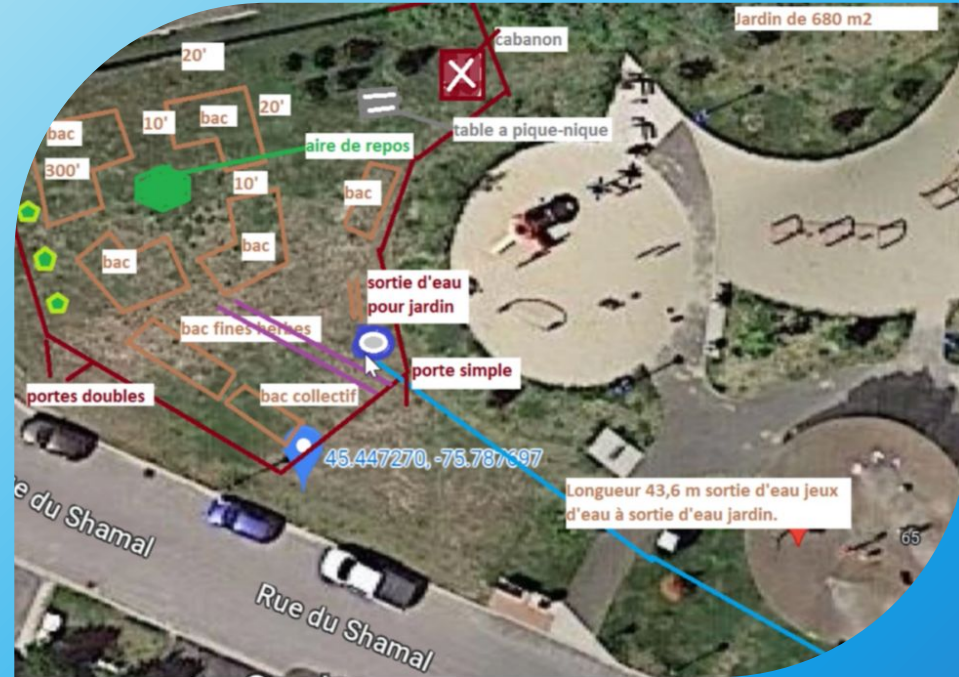
Jardin communautaire Carrefour des Brises Construction au Parc du Shamal