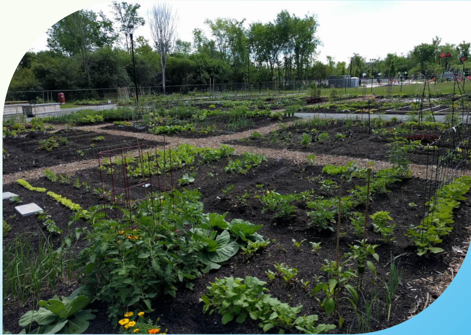
Jardin communautaire Serge-Bertrand Parc Central