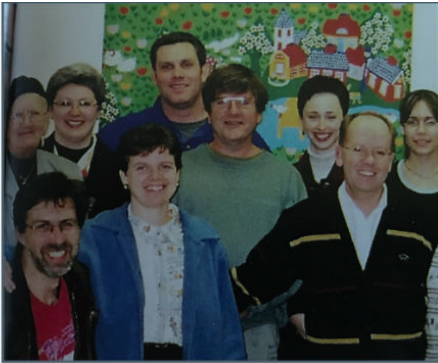
Une partie de l'équipe de 2000