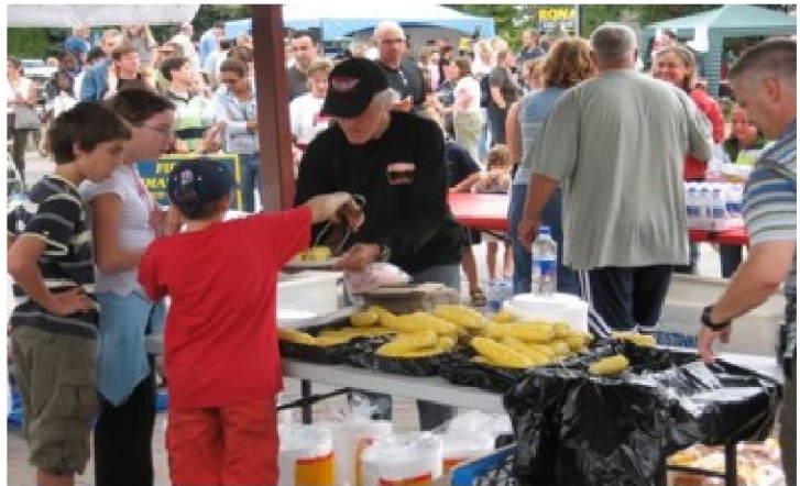
L'épluchette est l'activité la plus populaire du quartier

De plus, lors d'interventions, les contrevenants se déplacent dans la passerelle reliant la Rue de l'Orbite et la rue des Conifères pour ensuite