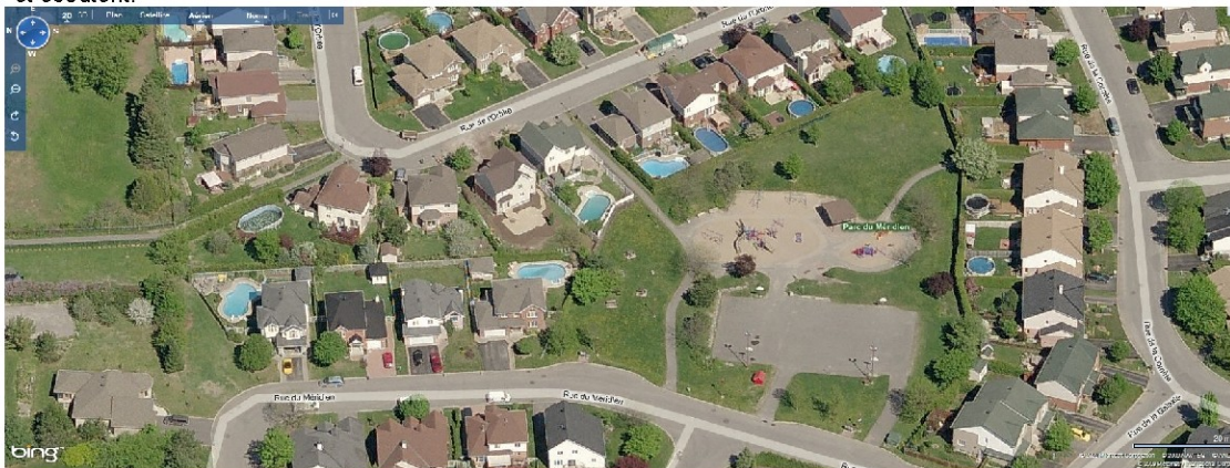
Le Parc Méridien et la passerelle reliant la Rue de l'Orbite et la Rue des Conifères